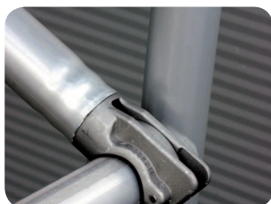
Spojení úchyty se vzpěrou je prolisem