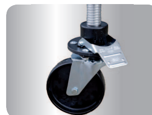
Pojízdná kolečka o průměru 200 mm mají dvojitý systém brždění. I při plné zátěži se snadno odbrzdí a mohou být výškově nastavitelná v rozsahu 25 cm.