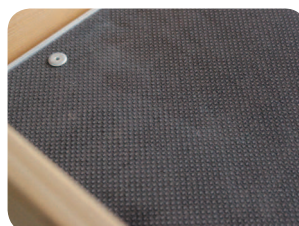
Podlaha je z protiskluzové překližky