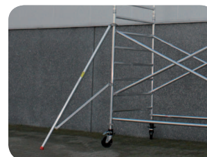
Trojúhelníková podpěra je plynule nastavitelná