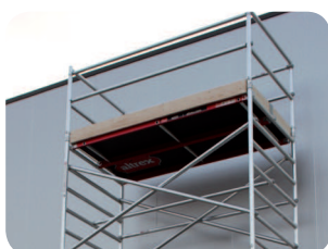
Dřevěné podlahy je velmi snadné převážet.